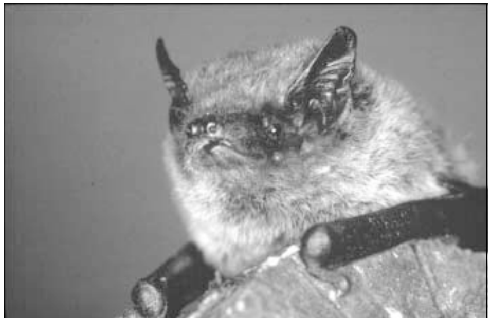
Verschwunden oder nur noch nicht richtig entdeckt? - Seit rund zwei Jahren konnten in Schaffhausen keine Weissrandfledermäuse mehr nachgewiesen werden.

Um herauszufinden, ob das „Verschwinden“ der Weissrandfledermaus aus Schaffhausen nur auf unsere lückenhaften Kenntnisse zurückzuführen ist oder ob wirklich etwas daran ist, sind wir natürlich weiterhin für jede Meldung, die einen Hinweis auf die Beantwortung dieser Frage geben könnte, dankbar.